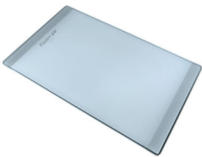
玻璃砧板 8631 300